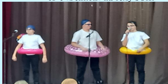
7Г – самые артистичные!