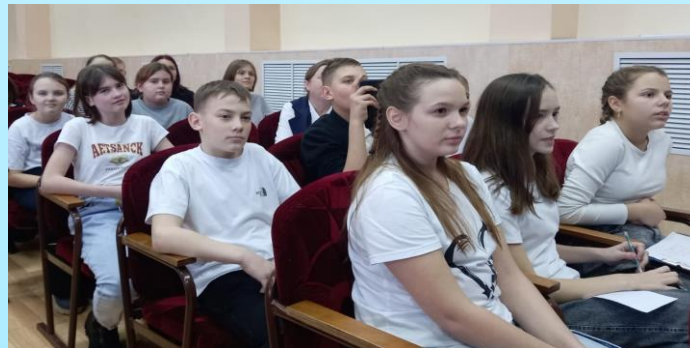
6А – само внимание!