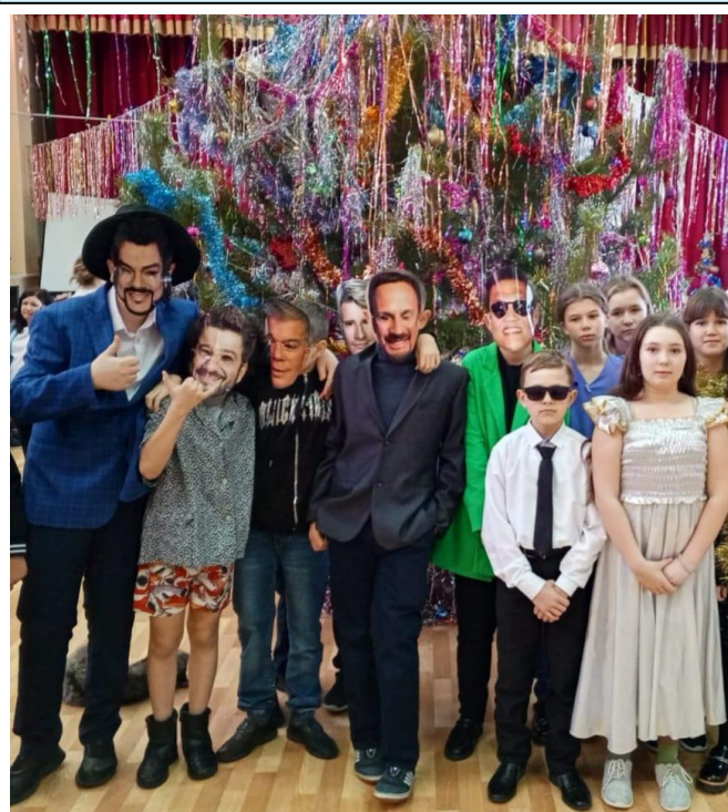
«Мы к вам заехали на чаааас...» - артисты из 5Д класса.

С Новым 2025 годом, ребята и взрослые! Пусть он будет мирным, добрым, светлым и щедрым на хорошие события!