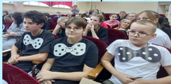
6Б класс – сама галантность!