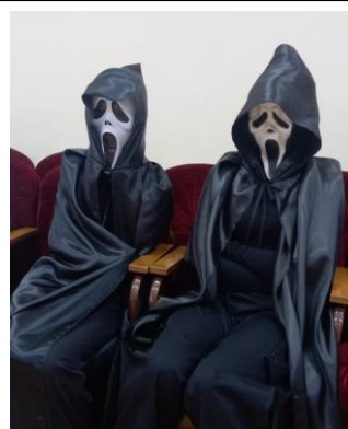
Пришли девчонки, сидят в сторонке...