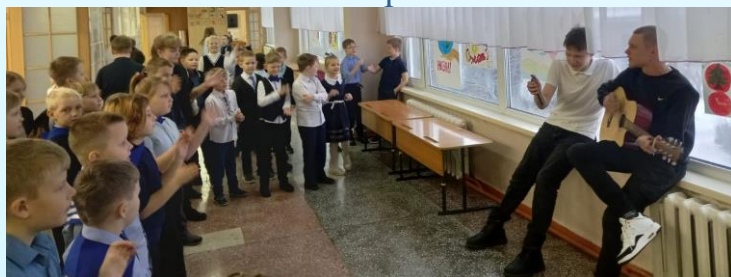
Песни под гитару – для младших классов