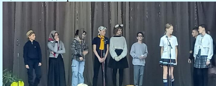
6Г с «Репкой» на тему ЗОЖ

Представляем вашему вниманию фоторепортаж с зажигательного КВНа, который прошёл своими весёлыми шагами по параллелям 5-8 классов с 19 по 22 ноября! Ребята соревновались в том, кто ярче и интереснее представит тему здорового образа жизни: пели, танцевали, показывали смешные сценки и видеоролики.