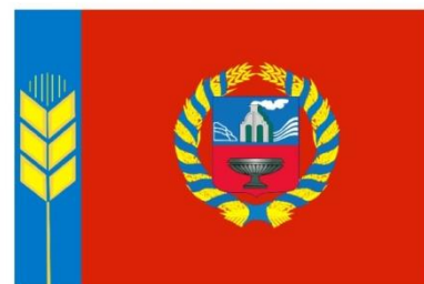
ФЛАГ АЛТАЙСКОГО КРАЯ