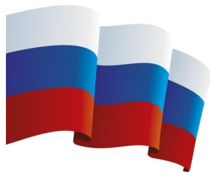
Флаг Российской Федерации