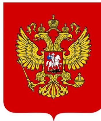
Герб Российской Федерации