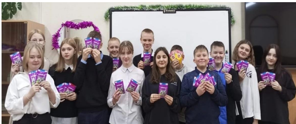
Ребята 8Е класса с новогодними подарками для питомцев: фото на память.