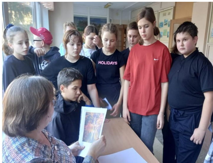
Этап «Экологичные и неэкологичные продукты»

Затем в театральном конкурсе команды экспромтом показывали русские народные сказки, переделанные на тему экологии. Наша группа за 5 минут подготовила сказку «Колобок»: её главный герой был испечён из отравленной гербицидами муки, переплыл загрязнённую речку, встретился с зайцем, объевшимся выросшей на нитратах морковью, с грустным слабым волком, питающимся неэкологичной пищей. В конце мы призвали зрителей соблюдать законы экологии.